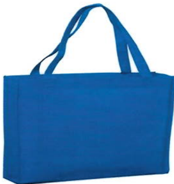
IMAGEN DE LO SOLICITADO